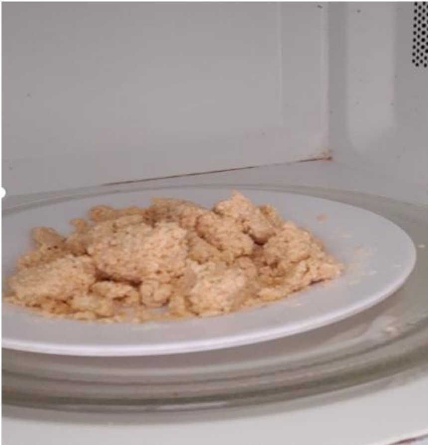
Foto 5: Amostra de uma porção da silagem (100 gramas) em forno micro-ondas antes do aquecimento.