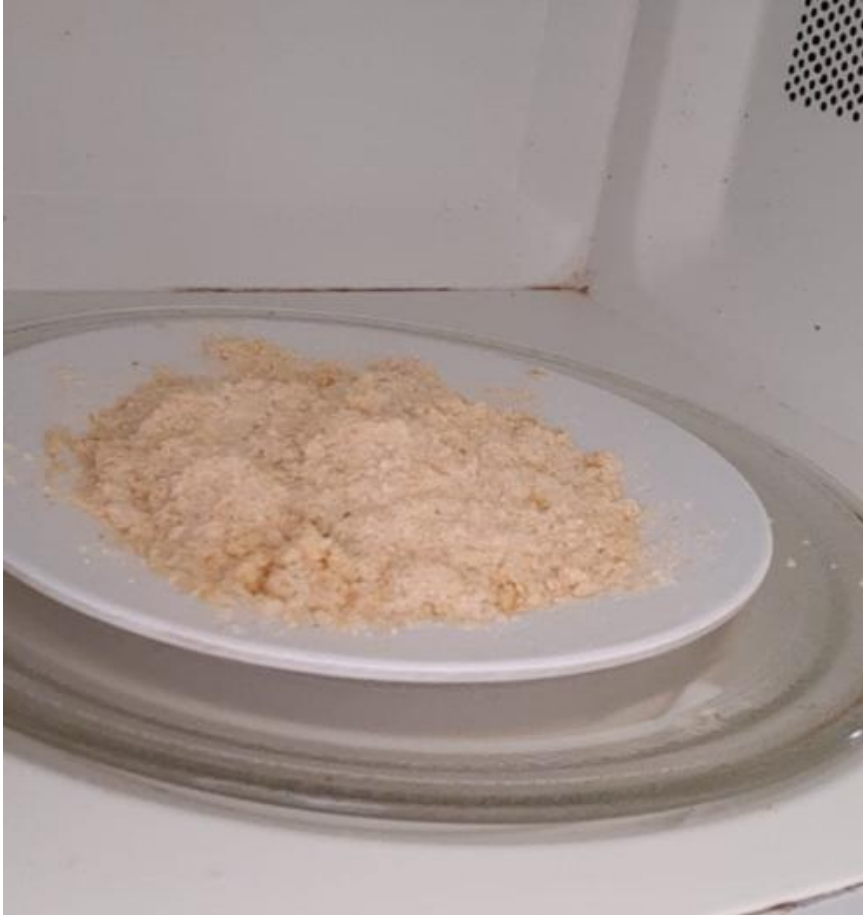
Foto 6: Amostra de uma porção da silagem de milho moído reidratado após desidratação em forno micro-ondas.