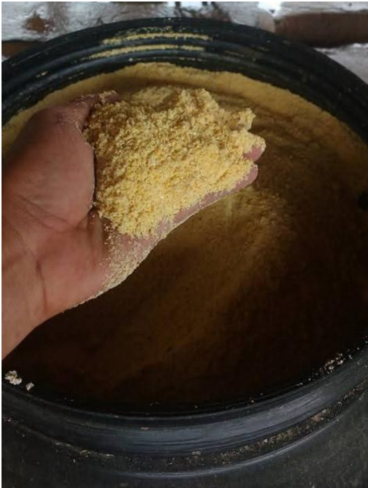
Foto 1: Silo de milho moído reidratado em tambor de 200kg.