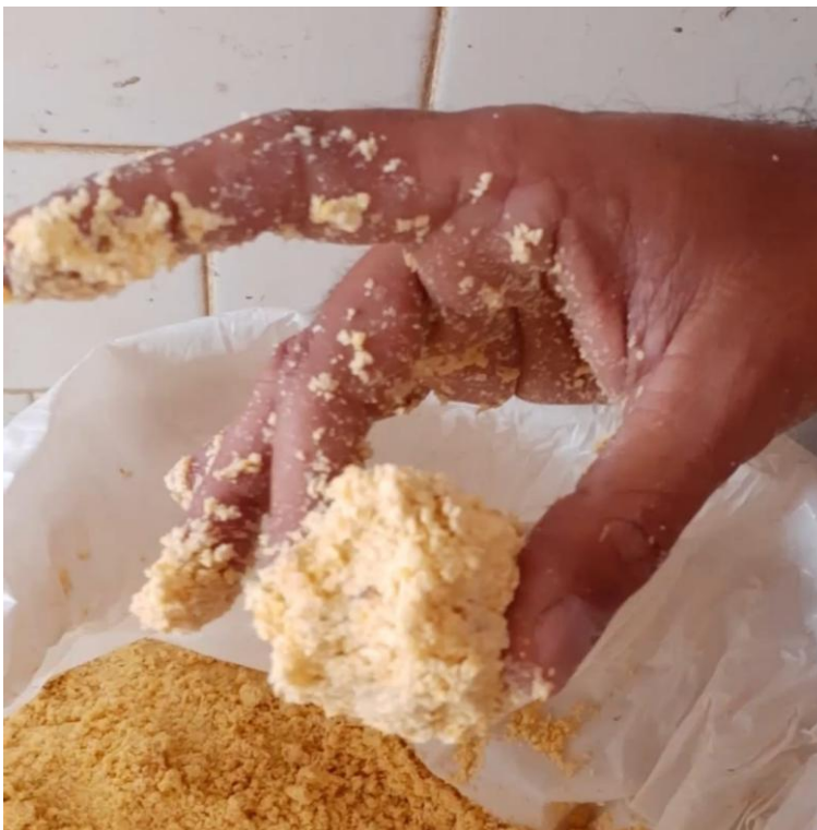
Foto 4: Avaliação visual do teor de umidade, ao apertar uma porção da silagem na mão, observa-se a formação de uma bola que se mantém coesa.

Importante: Se o resultado estiver menor que 35% de umidade, aumentar a vazão da água ou diminuir a quantidade de milho a ser moída; se o resultado estiver acima de 35% de umidade, diminuir a vazão da água ou aumentar o volume de milho a ser moída.