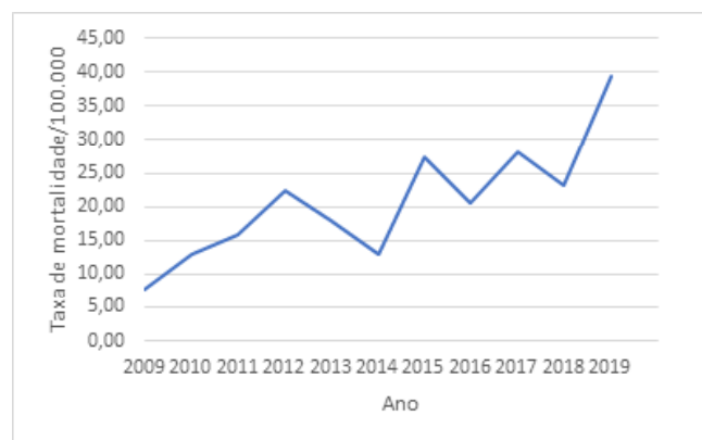
Figura 2. Taxa de mortalidade infantil por sífilis congênita no estado do Rio de Janeiro de 2009 a junho de 2019 por 100.000 nascidos vivos.