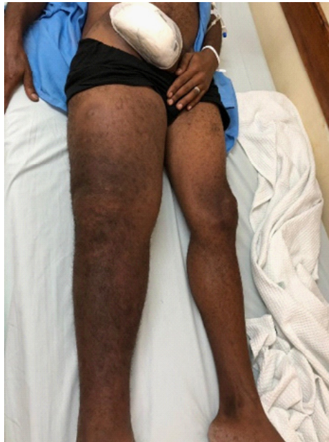
Figura 2 – Massa bulky à direita e edema em membro inferior ipsilateral