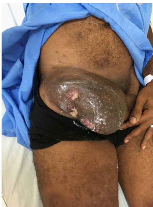
Figura 1 – Massa bulky em região inguinal direita

O histopatológico e o estudo imuno-histoquímico não puderam diferenciar entre LHPNL em LBRCT/H. O caso foi conduzido como LBRCT/H devido apresentação clínica avançada, com massa bulky e sintomas B, refletindo o caráter agressivo da doença. O estadiamento Ann Arbor foi definido como Estágio IVB X , sendo iniciado tratamento com 6 ciclos de R-CHOP (Rituximab, Ciclofosfamida, Doxorubicina, Vincristina e Prednisona), protocolo de primeira linha para LBRCT/H, apresentando redução >50% do tamanho da massa inguinal (Figuras 4A e 4B) e resolução completa das outras adenomegalias periféricas. No presente momento aguarda realização do PET-TC para melhor definição de resposta e encaminhamento para radioterapia de sítio envolvido como consolidação.