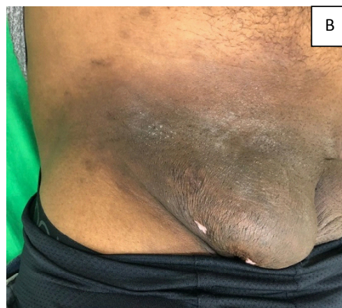
Figura 4A e 4B - Redução da massa bulky após quimioterapia com R-CHOP (Rituximab, Ciclofosfamida, Doxorubicina, Vincristina e Prednisona).