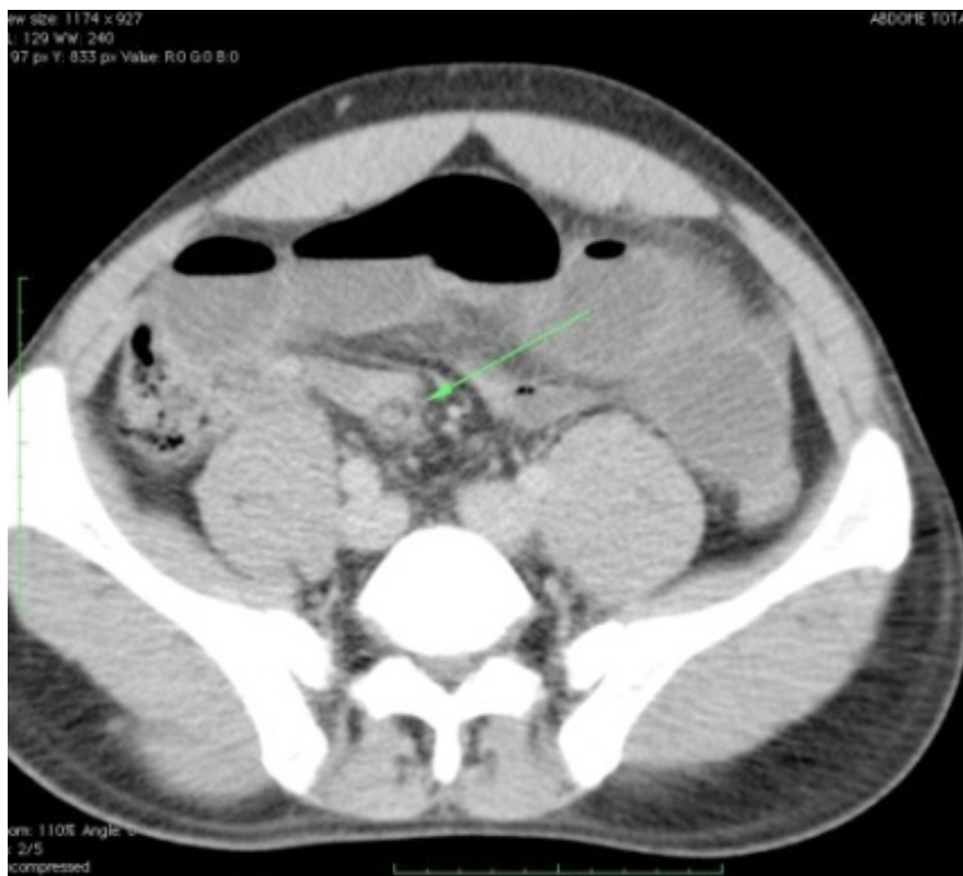
Figura 2. TC de abdome evidenciando também níveis hidroaéreos, além de distensão de intestino delgado e afilamento de íleo (autoria própria).

Foi internado em observação clínica no Serviço de Cirurgia Geral. O tratamento inicial consistiu de jejum, hidratação venosa, analgesia e cateterismo nasogástrico, que apresentou débito de 1.150 mL/24 horas. Após 48 horas, sem evidências de melhora do quadro abdominal que continuava distendido e doloroso, e o débito da sonda nasogástrica alto, optou-se por laparotomia exploradora mediana, por diagnóstico pré-operatório de obstrução intestinal por hérnia interna.