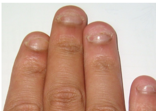
Figura 6. Fotografia 30 dias após do participante 2

As fotografias finais foram realizadas 60 dias após as fotografias iniciais, e representaram o crescimento contínuo das unhas durante esse período, como mostram as figuras 7 e 8, com grande recuperação nas unhas de ambos os pacientes e principalmente a regressão das lesões ao leito ungueal do paciente II.