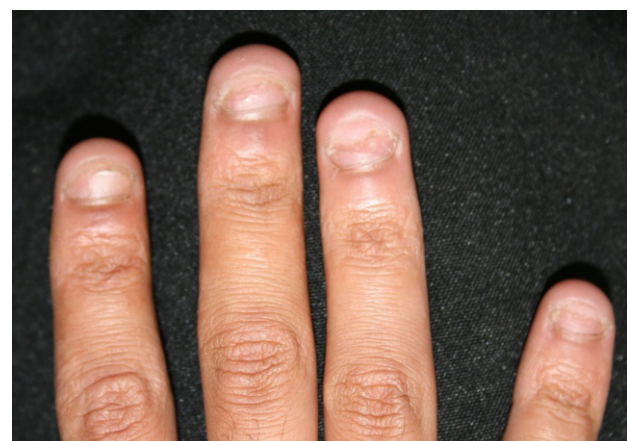
Figura 4. Fotografia inicial do participante 2