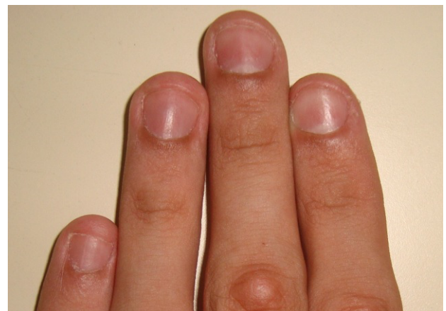
Figura 3. Fotografia inicial do participante 1

As figuras 3 e 4 mostram as fotografias iniciais dos participantes I e II respectivamente. Onde é possível observar o aspecto das unhas roídas do paciente I e no paciente II há lesão aos tecidos circundantes além dos sinais de unhas roídas.