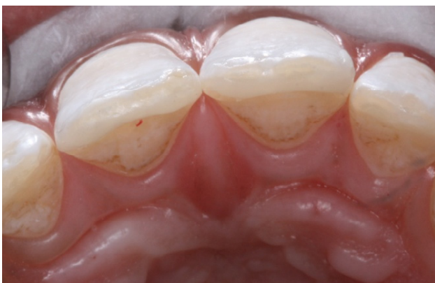
Figura 2. Impeditivo Instalado

É de extrema importância que se faça uma avaliação oclusal ao final do procedimento, a fim de não permitir qualquer interferência e/ou alteração no padrão de oclusão do participante, sendo que toda intervenção foi efetuada respeitando-se as normas éticas e de biossegurança, e o material utilizado de responsabilidade do responsável pela pesquisa.