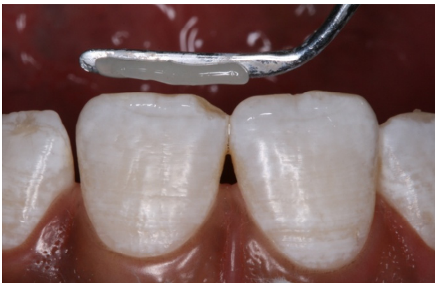
Figura 1. Confeção do Impeditivo

Inicialmente foi realizado o condicionamento ácido, utilizando ácido fosfórico a 37% por 30 (trinta) segundos, conforme orientação do fabricante do produto, em seguida o adesivo Scotchbond da 3M ESPE foi aplicado, dispensando o uso do primer por não estar em contato com dentina, e fotoativado por 20 (vinte) segundos. A resina utilizada foi a de classificação microhíbrida da marca Vigodent – Fill Magic, que permite um bom polimento e apresenta boas características de lisura. A aplicação foi efetuada, fotoativada em seguida, e após essa fase a oclusão foi testada, as figuras 1 e 2 mostram o impeditivo sendo confeccionado e o resultado final da instalação.